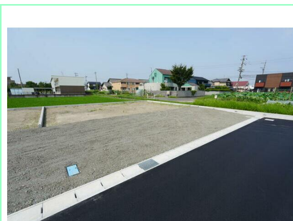
造成工事完了済☆上水道引き込み済です☆