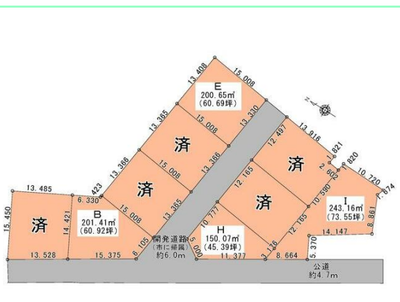
全9区画の分譲地です☆