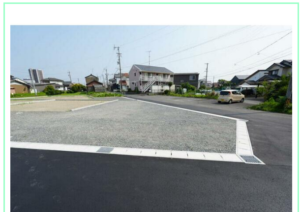
全9区画の宅地分譲地です☆

※この図面はATBBの物件情報の一部を抜粋して掲載しております。(現況優先) ※入居日・引渡日変更や付帯条件、別途料金が発生する場合がありますのでご確認ください。