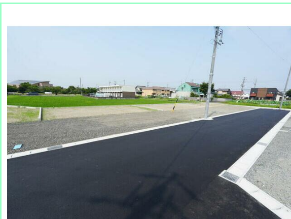
造成工事完了済☆上水道引き込み済です☆