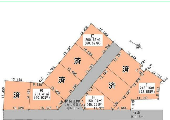
全9区画の分譲地です☆