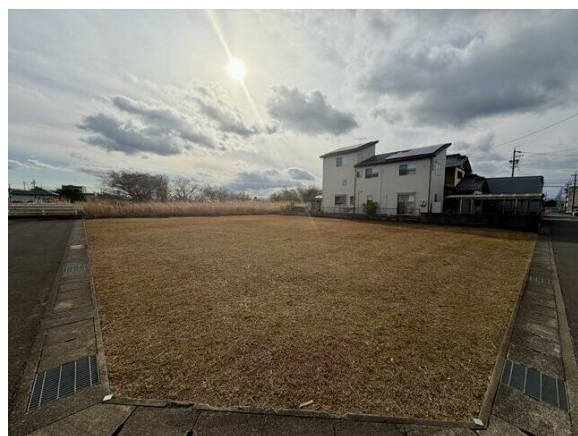
交通量の少ない静かな住環境☆