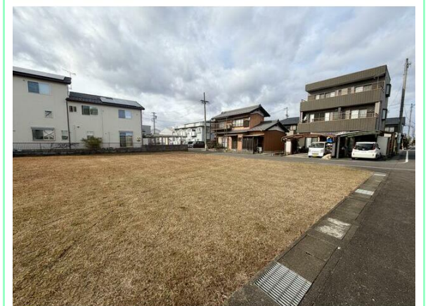
東側前面道路から敷地全景☆

※この図面はATBBの物件情報の一部を抜粋して掲載しております。(現況優先) ※入居日・引渡日変更や付帯条件、別途料金が発生する場合がありますのでご確認ください。