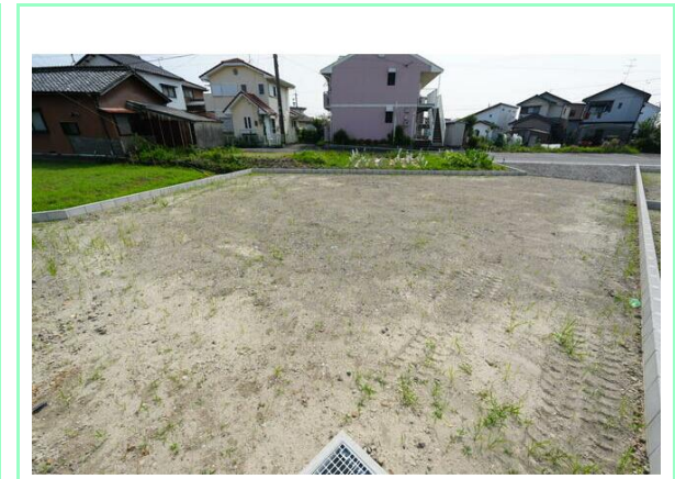
全9区画の宅地分譲地です☆

※この図面はATBBの物件情報の一部を抜粋して掲載しております。(現況優先) ※入居日・引渡日変更や付帯条件、別途料金が発生する場合がありますのでご確認ください。