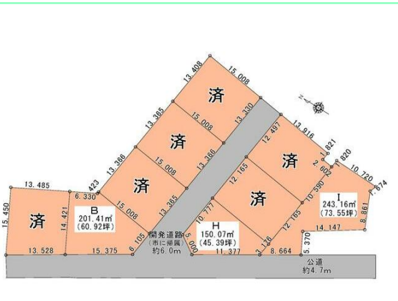
全9区画の分譲地です☆