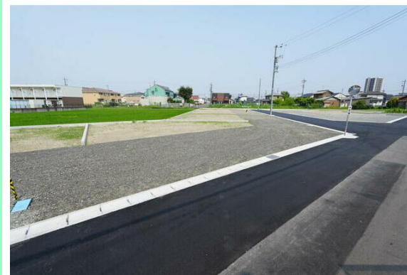
造成工事完了済☆上水道引き込み済です☆