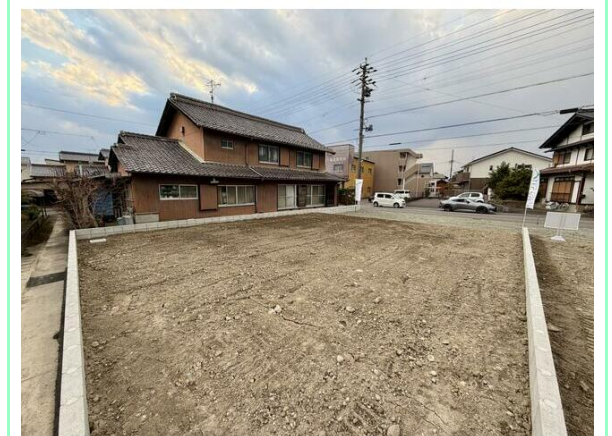
イオン柳津徒歩圏内の利便性の高い立地です☆

※この図面はATBBの物件情報の一部を抜粋して掲載しております。(現況優先) ※入居日・引渡日変更や付帯条件、別途料金が発生する場合がありますのでご確認ください。