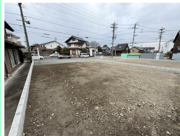
敷地面積 72坪超のため奥行にもゆとりがあります☆