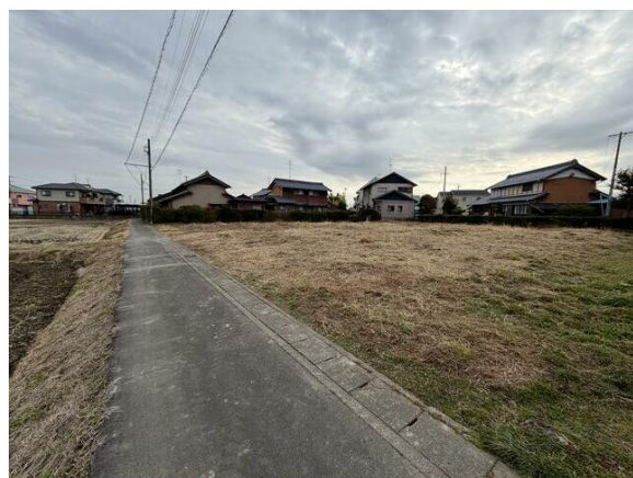
車両の往来が極めて少ない前面道路なので静かで安心できる住環境です☆