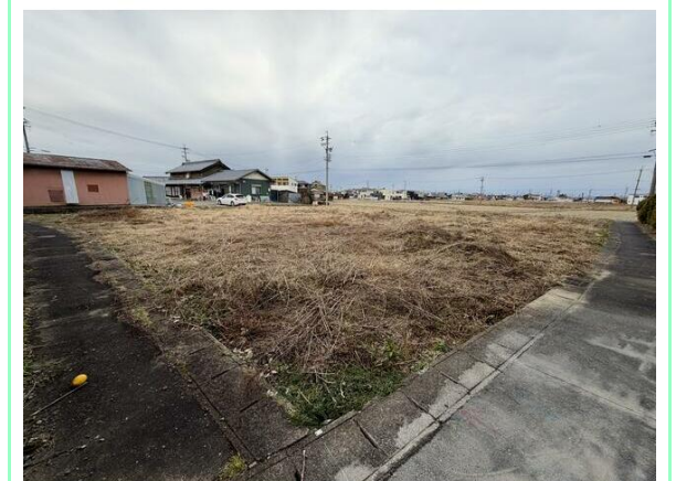
南東角から敷地全景☆

※この図面はATBBの物件情報の一部を抜粋して掲載しております。(現況優先) ※入居日・引渡日変更や付帯条件、別途料金が発生する場合がありますのでご確認ください。