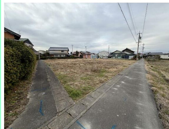
駐車場並列複数台駐車可能です☆