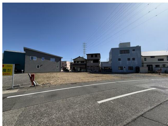
人気エリア☆建築条件なし☆