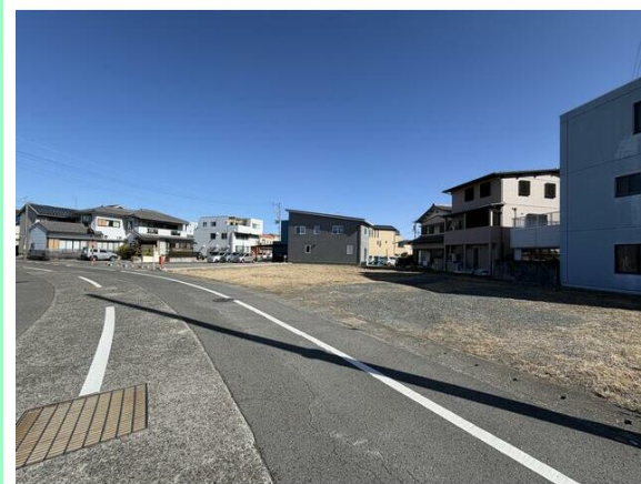
前面道路幅員10mのため、ストレスなく駐車することが可能です☆