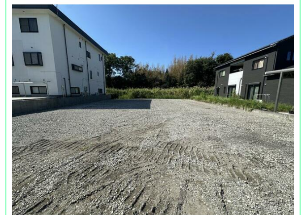
地目変更 (田→宅地) 後のお引渡しです☆

※この図面はATBBの物件情報の一部を抜粋して掲載しております。(現況優先) ※入居日・引渡日変更や付帯条件、別途料金が発生する場合がありますのでご確認ください。