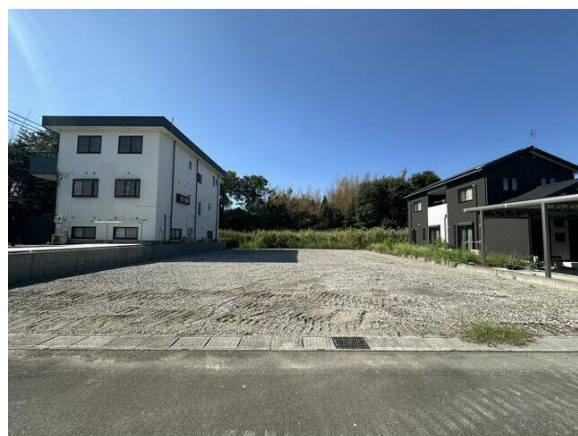
交通量の少ない前面道路です☆