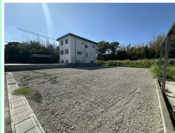
造成工事完了済みです☆