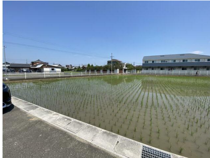
造成工事完了後のお引渡し☆

トミダヤ岐大店まで1438m, 上州屋岐阜穂積店まで1470m, マックスバリュ穂積店まで1657m, ロピア柳津店まで4742m, SUPER CENTER PLANT-6 穂積店まで2494m, ミニストップ瑞穂朝日大学前店まで600m, ファミリーマート瑞穂中原店まで1120m, セブンイレブン瑞穂野白新田店まで1972m