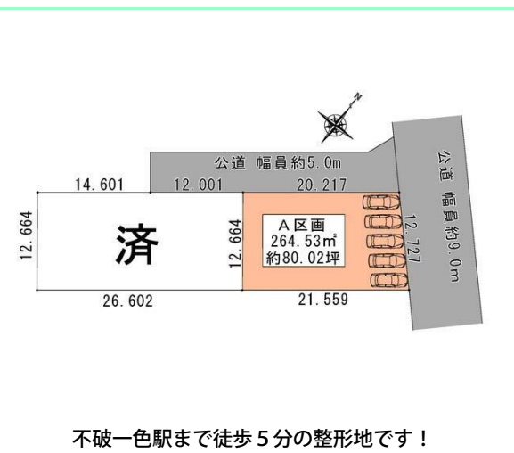
不破一色駅まで徒歩5分の整形地です!