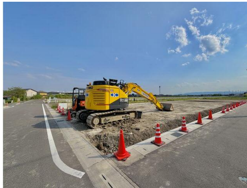
敷地面積80坪の整形地! 上下水道引込完了後のお引渡しです☆