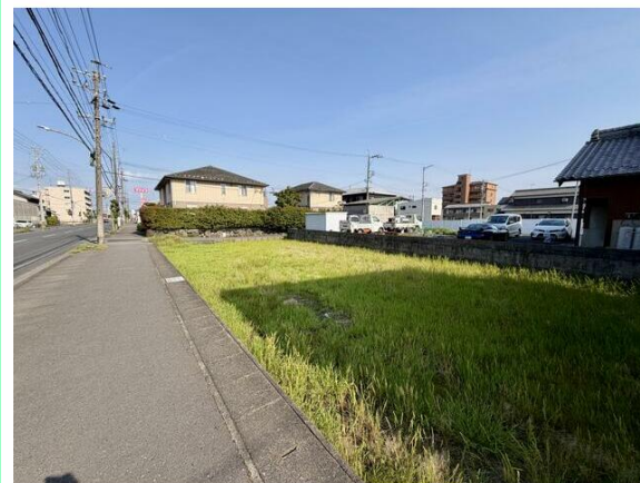
造成工事完了後、お引渡し！