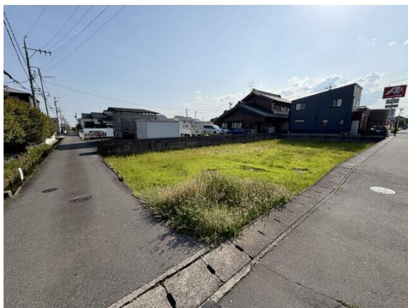
敷地面積109坪の整形地！間口も広々！