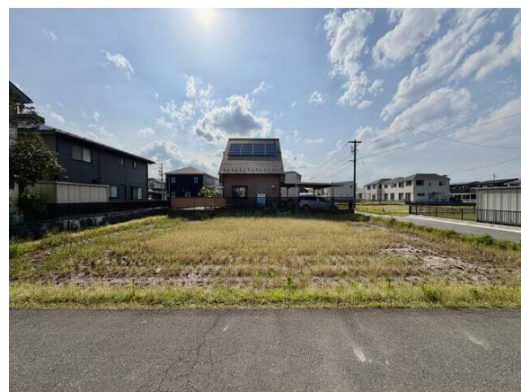
東側間口約16.9mあり、前面道路幅員6.6mで駐車楽々！