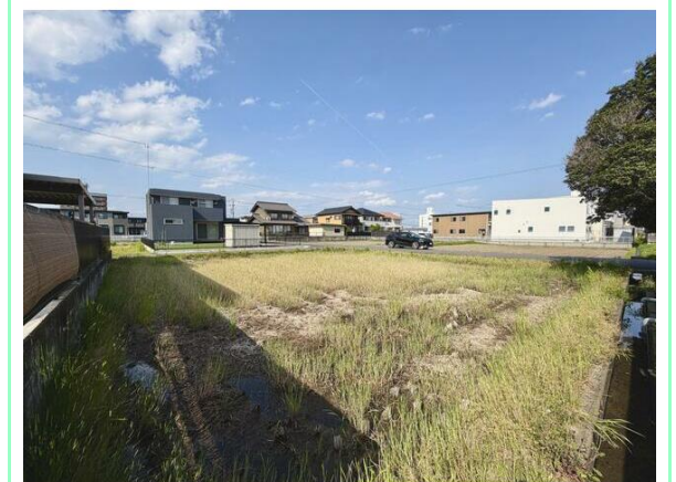
上水道引込工事・造成工事完了後にお引渡し！

※この図面はATBBの物件情報の一部を抜粋して掲載しております。(現況優先) ※入居日・引渡日変更や付帯条件、別途料金が発生する場合がありますのでご確認ください。