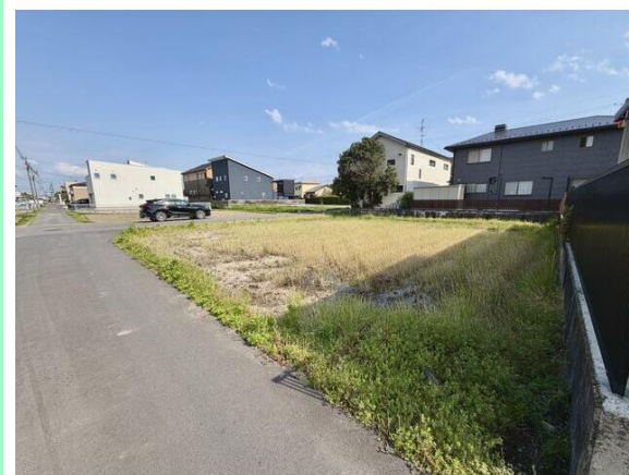
見通しの良い前面道路です！