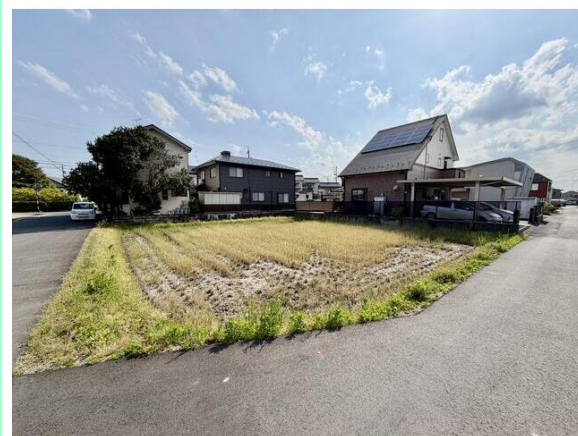
北側間口約14.5mあり、並列駐車6台可能です！