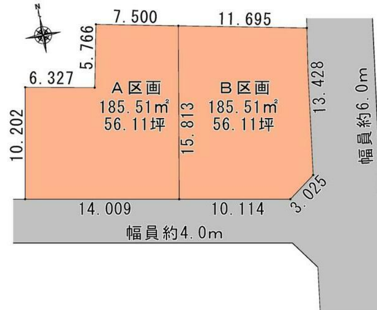
A+B区画！敷地面積約112坪！南向き！間口24mで広々！