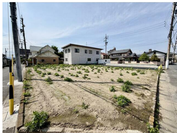
南向き角地！間口が広く駐車楽々！