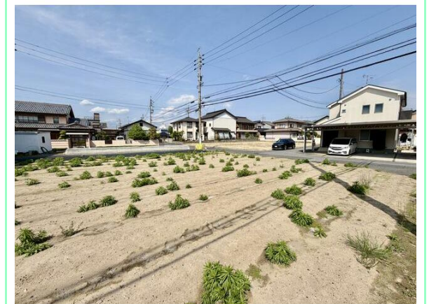
東側前面道路幅員6.0m！間口13mあり間口広々！

※この図面はATBBの物件情報の一部を抜粋して掲載しております。(現況優先) ※入居日・引渡日変更や付帯条件、別途料金が発生する場合がありますのでご確認ください。