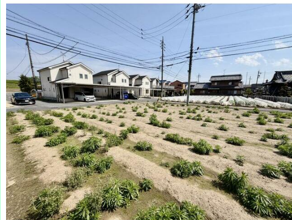
上下水道引込工事・造成工事完了後にお引渡し！